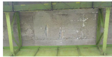
床版下部損傷状況