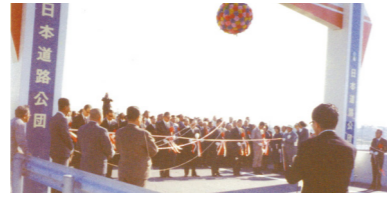
東名阪道の開通時(1975年10月)

開通からおよそ半世紀を迎える E23 東名阪道。長きにわたり愛知・三重をつなぎ、物流・通勤・レジャーなど多くのお客さまにご利用いただけてきました。 老朽化が進む E23 東名阪道では、集中工事など定期的に補修工事を実施させていただいておりますが、部分的な補修の繰り返しだけでは改善できないため、抜本的な補修を実施します。