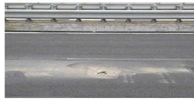
橋の劣化に起因する路面の損傷