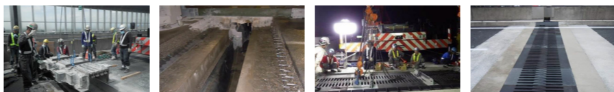
1. 既存の橋梁伸縮装置を撤去 2. 橋梁伸縮装置の撤去後の状況 3. 新しい橋梁伸縮装置の設置 4. 工事完了