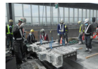
既存の伸縮装置を撤去

E1A 伊勢湾岸道は、非常に交通量が多いため、金属疲労による伸縮装置の亀裂や破断などの損傷が目立っています。平坦性の確保と道路の安全性を強化するために、早急に取り替える必要があります。