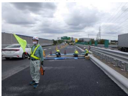
伸縮装置点検状況