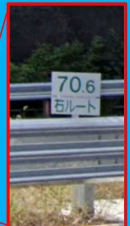
写真は、全て2020年度の状況

NEXCO中日本お客さまセンター TEL0120-922-229(フリーダイヤル) TEL:052-223-0333(上記電話をご利用できない場合/通話料有料)